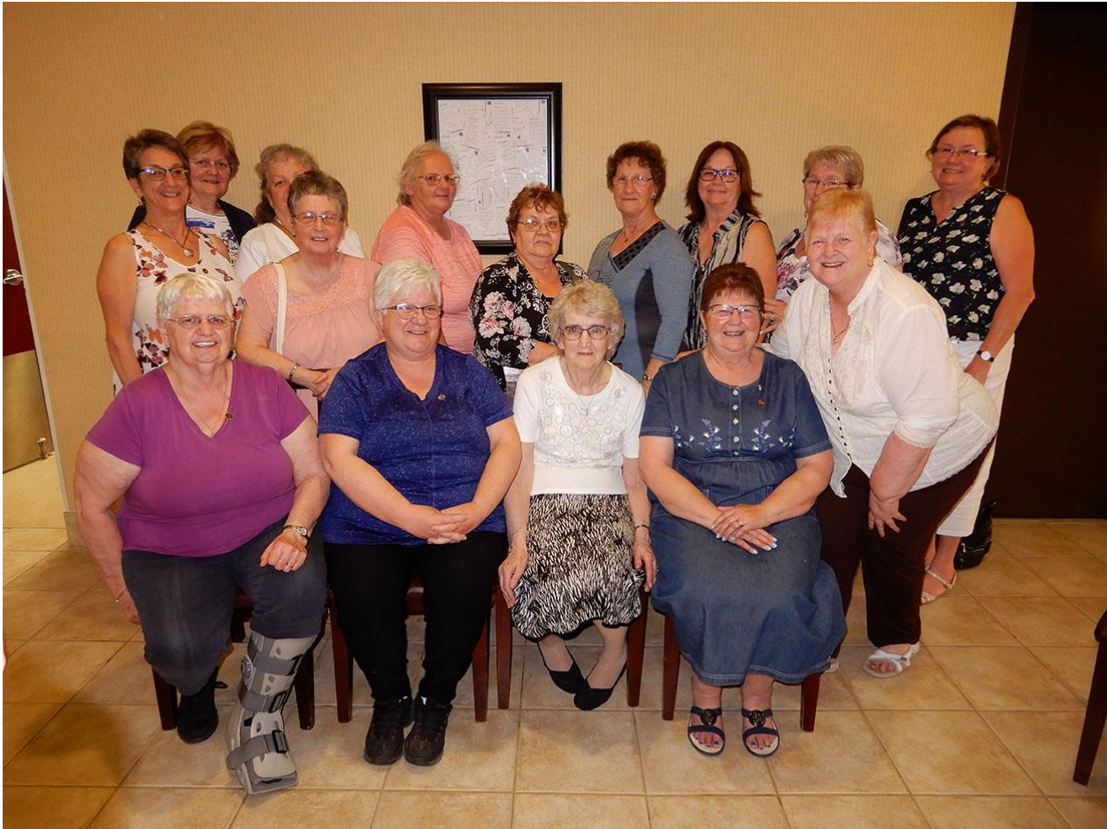
Conseil d'Administration 2019 - 2020